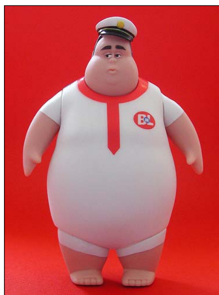
Befälhavaren ombord på rymdskeppet Axiom. (ur filmen Wall-E)

Det finns inte längre något liv kvar på jorden. Det enda som rör sig är en liten soldriven sopsorteringsrobot som heter Wall-E som fortsätter sitt mekaniska värv att försöka städa upp efter människorna