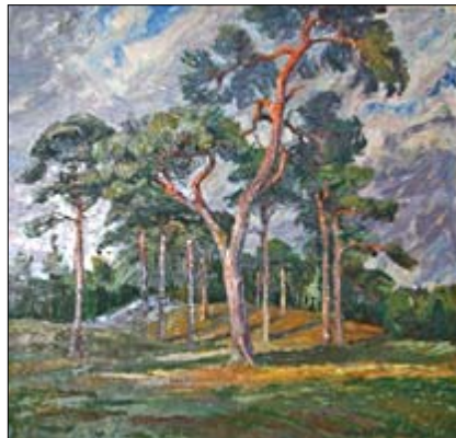
Tallen (Albert Larsen), oljemålning

Vilket var träet, vilket var trädet, som himmelen och jorden timrades av?