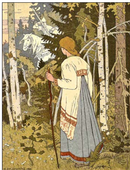
Vasilissa möter den vite ryttaren. (ill.)

För första gången var styvmodern och styvsystrarna vänliga när de mötte henne. De sade att de inte haft någon eld sedan hon lämnat dem och att den de fått av grannarna hade slocknat så fort den kom in i rummet. "Din eld kanske inte slocknar," sade styvmodern och tog döds skallen med sig in i rummet. Men de glö-