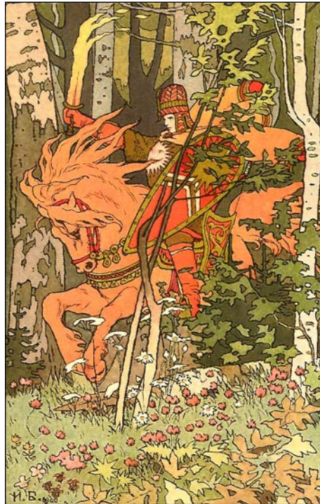
Vasilissa möter den röde ryttaren. (ill.)

Barnets fantasier om egna barn projiceras ofta på dockor, men det är inte dockans enda funktion. I den tidiga barndomen blir den också ett slags gudomlig skyddsande. Ofta kan små barn mellan ett och ett halvt och fyra år inte somna om de inte har sin tvättlapp, sin teddybjörn eller någon annan fetisch på kudden. Den måste finnas på sin bestämda plats annars kommer inte sömnen och barnet är utlämnat