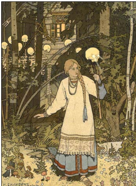
Vasilissa och dödskallen (ill.:

Här kanske man kan finna orsaken till att de flesta verkligt goda medicinmän aldrig gör reklam för sig själva. De har ingen ”terapeutisk entusiasm” och snokar inte frivilligt omkring i mörkret. De begränsar sig till det onda som verkligen läggs fram för dem. Bara om någon som verkligen är förföljd av olycka ber om hjälp, ger de med sig, om också motvilligt, och utför en ritual för den nödlidande. Det visar att de är medvetna om det ondas farliga och vitala realitet. Om det gäller någon man håller av, kan det naturligtvis hända att man kan hjälpa till att bära den personens öde och utsätta sig för hans eller hennes mörker. Men annars är det bättre att inte väcka den björn som sover, eftersom det kan visa sig att björnen är en djävul som borde fått sova i fred.