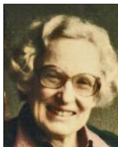
Marie-Louise von Franz (1915-1998), under många år en av C G Jungs närmaste medarbetare, höll många föreläsningar vid CG Jung-institutet i Zürich som har blivit klassiska. Denna artikel är en redigerad version av anteckningar från en föreläsning hon höll 1959.

Det är en stor glädje för oss att vi i detta och några följande nummer av CJP Nyhetsbrev kan fortsätta med Marie-Louise von Franz föreläsningsserie om folksagans kvinnobilder. I denna del, som hon kallat Konfrontationen med den Stora Modern, utgår von Franz från en rysk folksaga, Den sköna Vasilissa, så som den återges i Loepfe, W.: Russische Märchen. De tidigare avsnitten i denna serie finns på vår hemsida www.cjp.se .