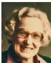
Marie-Louise von Franz (1915-1998), under många år en av C G Jungs närmaste medarbetare, höll många föreläsningar vid CG Jung-institutet i Zürich som har blivit klassiska. Denna artikel är en redigerad version av anteckningar från en föreläsning hon höll 1959.

Jung ägnade många års studier åt alkemin. Det var ett sedan länge bortglömt och ringaktat forskningsområde som med ens fick nytt liv, i och med att han bokstavligt talat grävde fram den ur det förgångnas avskrädeshögar. Det faktum att man tidigare kunde få tag i utomordentligt fina böcker i ämnet för bara ett par kronor styck, men numera måste betala mångdubbelt mer för även relativt obetydliga häften är Jungs "förtjänst". Intill dess hade det inte funnits någon egentlig kunskap om alkemi på annat håll än inom vissa frimurarkretsar och bland sentida rosenkruzare.